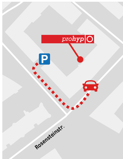
EINFAHRT ZUR TIEFGARAGE

Prohyp GmbH Rosensteinstraße 9 70191 Stuttgart